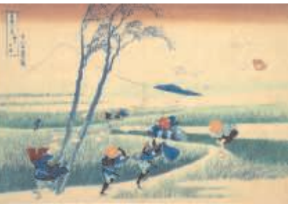
'A sudden gust of wind, naar de Japanse prent van Hokusai (1760-1849)