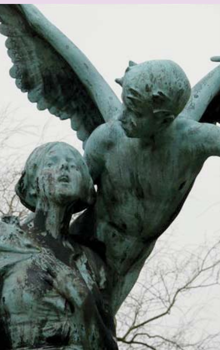
grafmonument Peter Benoit